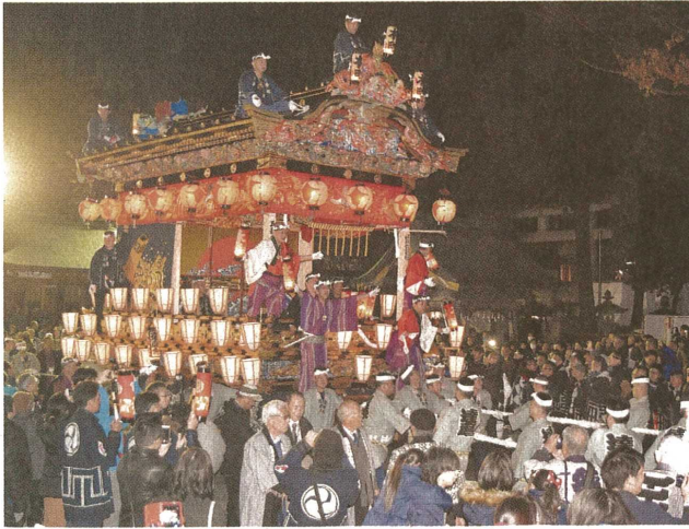
「全国山・鉾・屋台保存連合会」の総会に合わせ、特別曳行した本町屋台―1日後8時、秩父市番場町の秩父神社

同日の市内宿泊者も対象に。参加者らはちよつちやんやぼんぼりで彩られた豪華絢爛(けんらん)な本町屋台を曳き回した。16年にユネスコ無形文化遺産にも登録された冬祭の一足先に体験した。秩父夜祭の宵宮となる2日は祭屋台等製作修理技術者研修会(下郷笠鉾(かきぼり)の組み立てを視察。同日は通常、官地、本町、中町、上町の屋台4基が曳行するが、3日の大祭で曳行する中近笠鉾も特別に秩父神社周辺を曳行する。中近笠鉾が2日に曳行するのは明治12(1879)年以來で、139年ぶりの秩父夜祭の問い合わせは、秩父まつりの対策本部(☎0494-225-5209)へ。