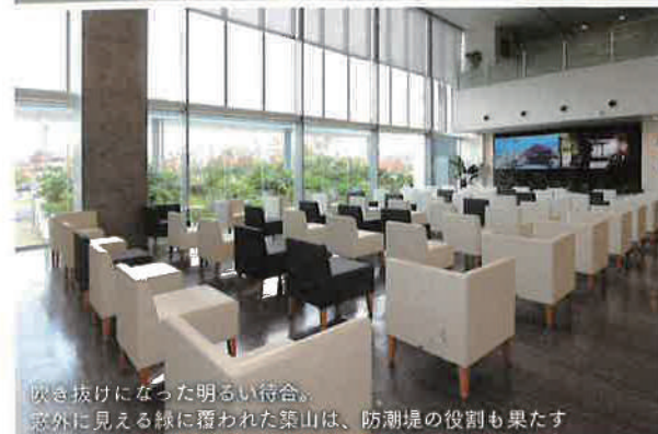
吹き抜けになった明るい待合。窓外に見える緑に覆われた築山は、防潮堤の役割も果たす