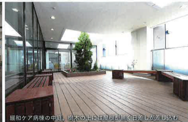
緩和ケア病棟の中庭。樹木の上には屋根が無く日差しが差し込む