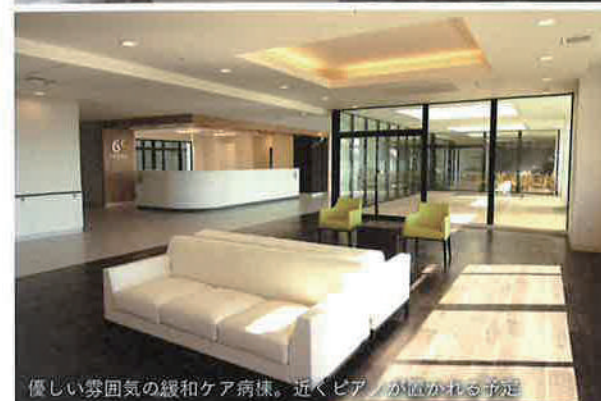
優しい雰囲気緩和ケア病棟。近くピアノが聴かれる予定