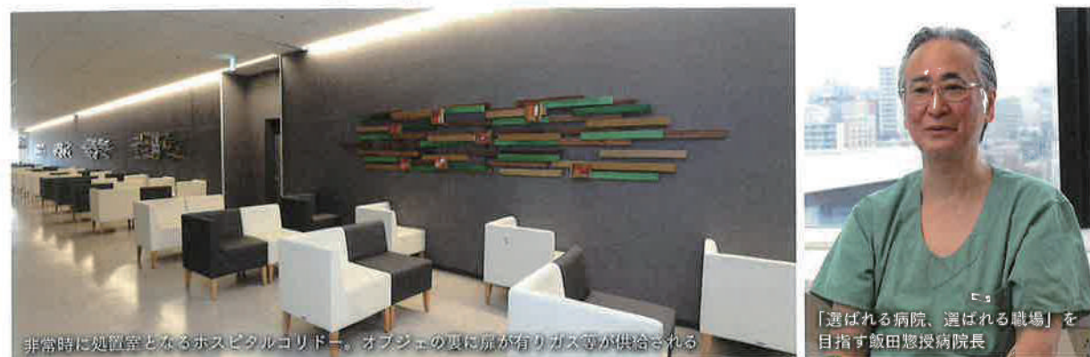
非常時に処置室となるホスピタルコリドール。オブジェの裏に扉がありガス等が供給される

う平仮名を使った親しみやすい名称になった。病院の出入りに続くプロムナードはケヤキ並木になっていて、春は新緑、秋は紅葉が美しい。大学に有った並木を残したもので、病院を安らぎの空間にする大切な役割を果たしている。又、病院建設の為に伐採したケヤキは、木材のブロックにして病院内のインテリアに生かした。東洋大学ライフデザイン科の学生達がデザインし、学生や病院職員、地域の人々が参加して木材に色を塗り、アートとして完成させたのだと言う。外来の待合やホスピタルコリドールの壁を飾るオブジェには、