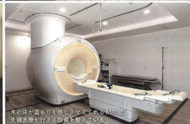
木の床が温もりを感じさせてくれるMRI室。先端医療が行える設備を整えている